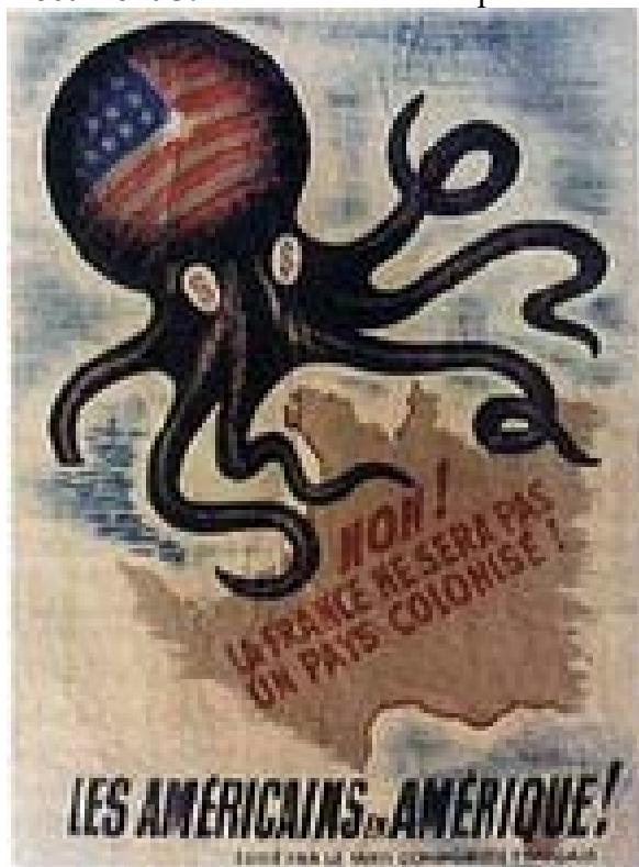
Affiche du Parti Communiste Français (vers 1950)