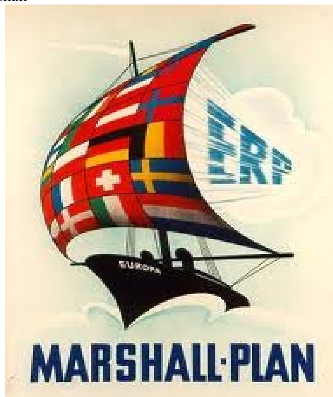
Affiche pour le Plan Marshall, réalisée par la Haute-Commission alliée (organe suprême des trois alliés occidentaux en RFA), 1950